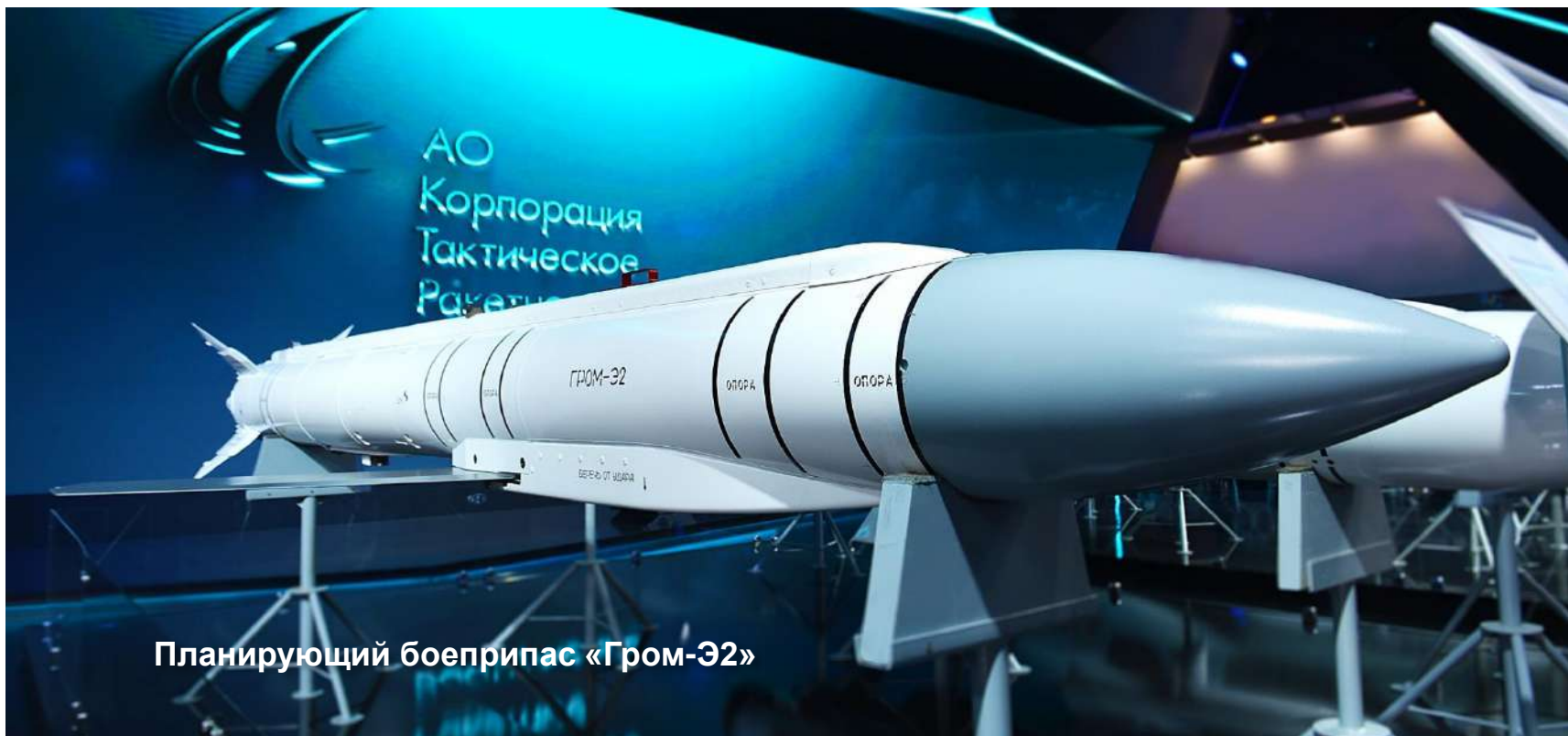
Планирующий боеприпас «Гром-32»