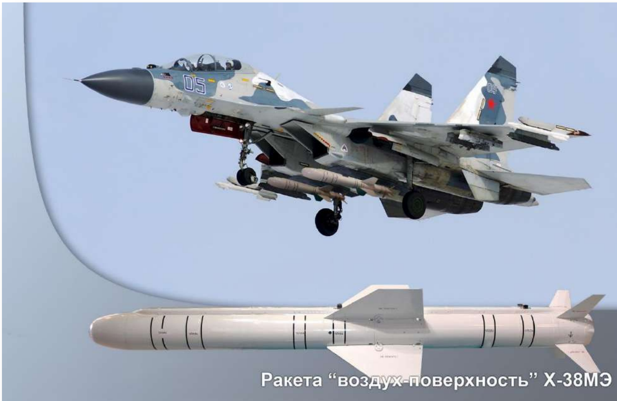
Ракета "воздух-поверхность" X-38MЭ